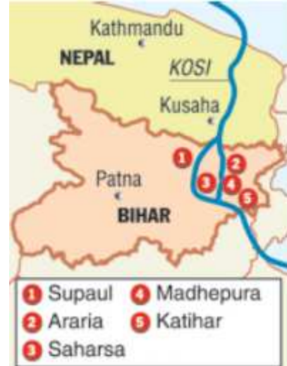
तालिका:1 2008 की बाढ़ का असर

इस अप्रत्याशित बाढ़ की चपेट में बिहार के 18 जिले आ गए। इनमें से सुपौल, अररिया, मधेपुरा, सहरसा और पूर्णिया (दायों ओर के चित्र को देखें) में बाढ़ का असर सबसे अधिक रहा। इस बाढ़ के कारण अप्रत्याशित क्षति व बर्बादी हुई। आपदा प्रबंधन विभाग के उपसचिव के द्वारा 23 सितंबर, 2008 को जारी डेली रिपोर्ट के अनुसार बिहार के 18 जिलों के 114 प्रखंडों के 2528 गांव बाढ़ की चपेट में आए। इस बाढ़ से कुल 47 लाख लोग प्रभावित हुए। बाढ़ के कारण 235 लोगों की मौत हो गई। इस रिपोर्ट की मुख्य बातें तालिका एक में उद्धृत की गई हैं: